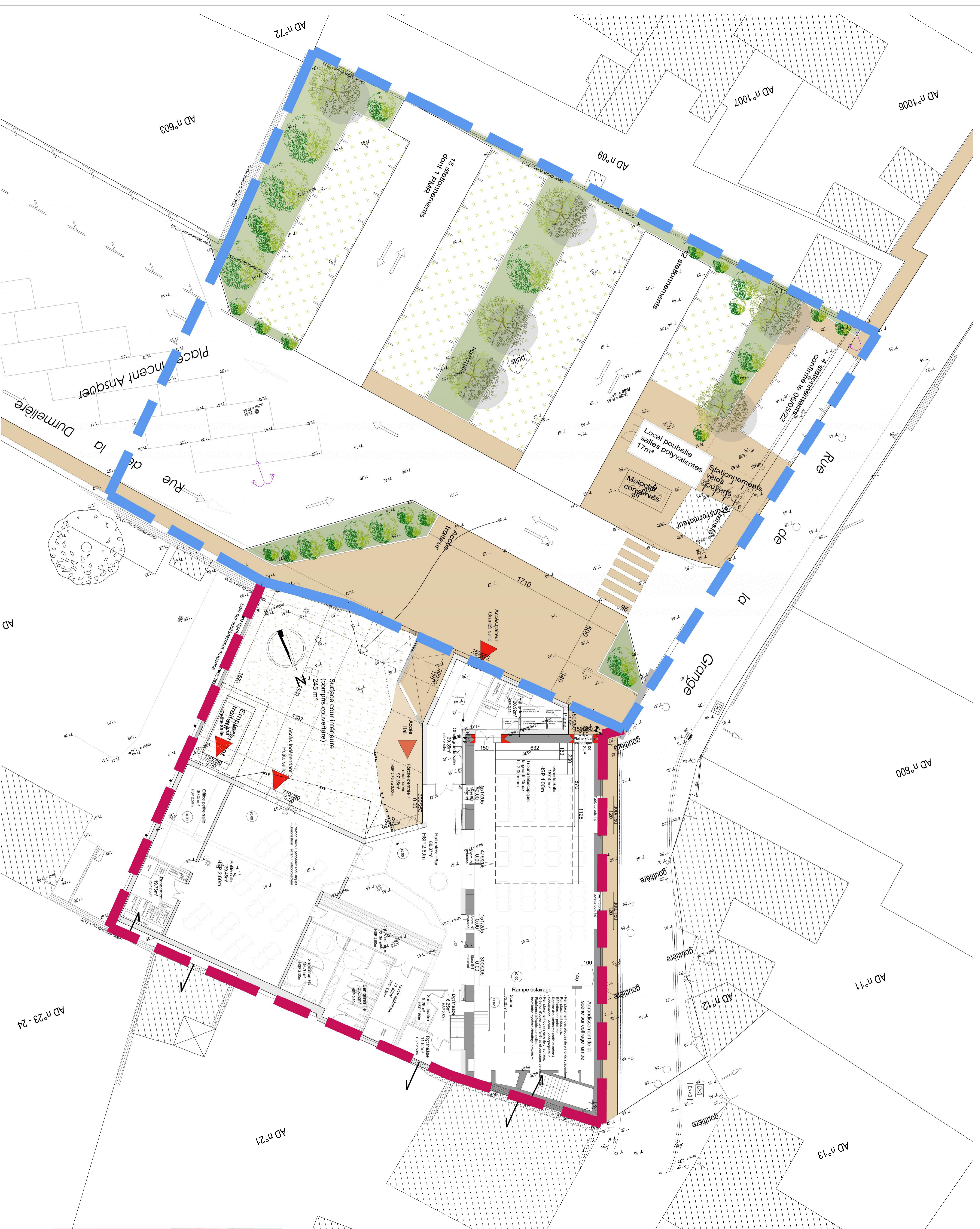
Plan de RDC et Aménagement du parking - Ech 1/100°